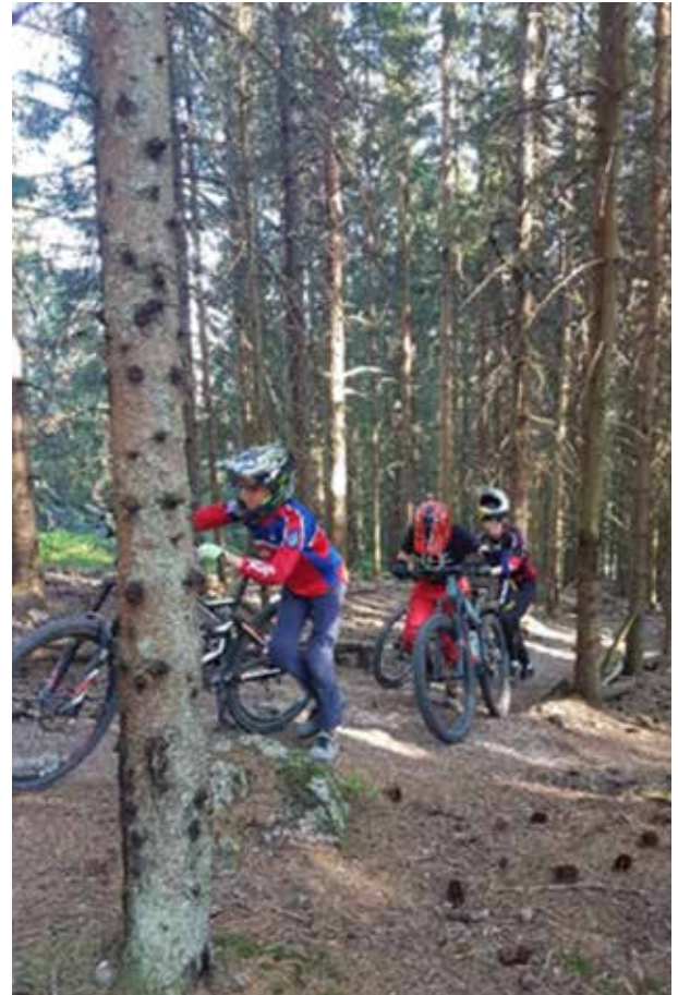
Over: Pushbike i varmen, Frognerseieren. Under: Pølsepause under trening, Drammen.