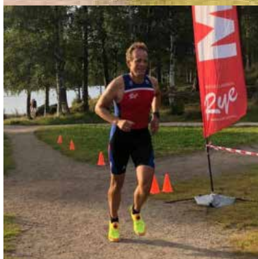
Klubbmesterskap 19. august.